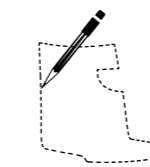
Schalenkonturen frei wählbar free choice of shell contours