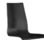
200 | H 900 mm