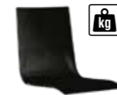
201 | H 900 mm nur bei Schwerlast- variante erhältlich only available with heavy duty variant