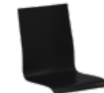
s200 | H 900 mm