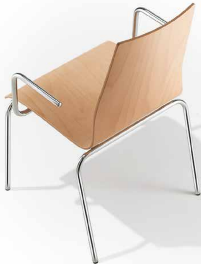
Schale mit Buchefurnier | Gestell aus Stahlrohr, verchromt shell with beech veneer | frame made of steel tube, chrome-plated