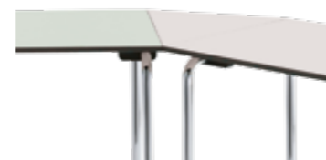
Einhängeplatte Dreieck intermediate table top, triangular