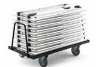
Tischwagen 001 table trolley 001