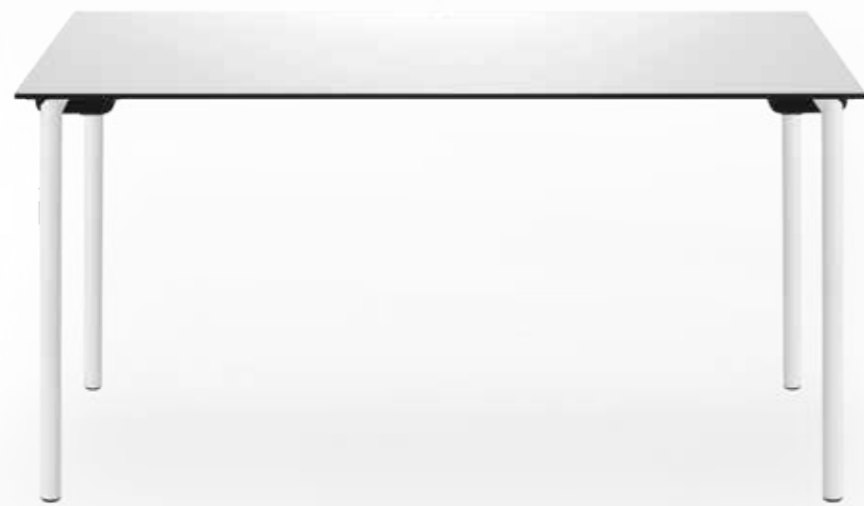
HPL-Vollkernplatte weiß mit schwarzer Kante, Gestell weiß pulverbeschichtet · white HPL solid core panel with black edge | white powder-coated frame