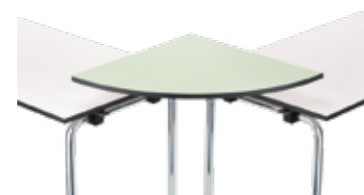
Einhängeplatte gerundet intermediate table top, rounded