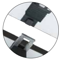
feste Verbindung lock | unlock