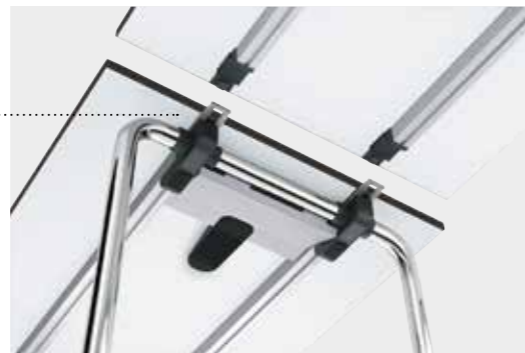
Einhängeplatte Rechteck intermediate table top, rectangular