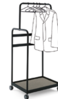
Tischwagen 002 table trolley 002