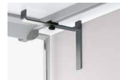
Sichtblendenbefestigung "Classic" screen fixation "classic"